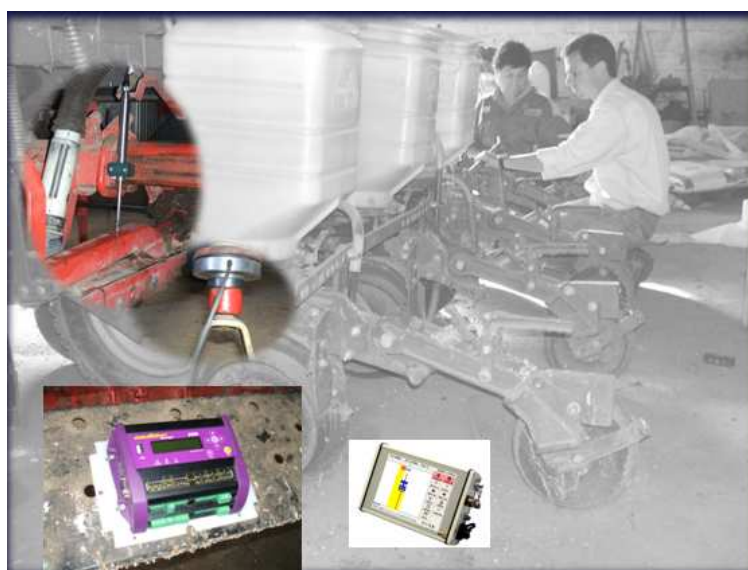
Figura 3 – Sensor de variação linear, célula de carga, data logger e GPS acoplados no semeador

A monitorização de informação obteve-se a partir da instalação numa das linhas do semeador de um sensor de carga, um sensor de indução magnética, um data logger e um GPS alimentados a partir de um conjunto de baterias de 12 V a 24Ah conforme mostra a figura 3.